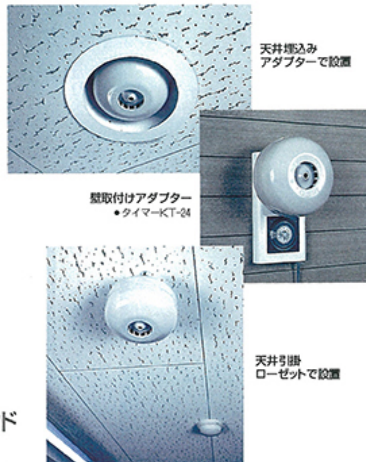
天井埋込み アダプターで設置

殺菌と脱臭は、「クリーンディー」におまかせ。オゾンは、生鮮食品の鮮度を保つだけでなく、医療関係や産業関係、そして私たちの日常においてもその殺菌・脱臭効果は広く知られています。ですから魚・肉処理場はもちろん、ご家庭での生ゴミの臭い、犬や猫などのペットの臭い、ロッカールームやトイレなどの臭い対策に効果的。イヤな臭いの微粒子をオゾンが捕捉し、無臭化します。また、目に見えない細菌はもとより、ウィルスやカビ類も科学的に無害化しますからクリーンな環境を作ります。