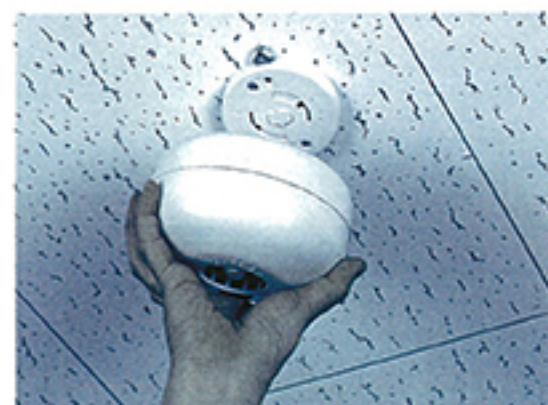
ワンタッチ式で、設置、メンテ等がカンタンに行なえます。

殺菌と脱臭は、「クリーンディー」におまかせ。オゾンは、生鮮食品の鮮度を保つだけでなく、医療関係や産業関係、そして私たちの日常においてもその殺菌・脱臭効果は広く知られています。ですから魚・肉処理場はもちろん、ご家庭での生ゴミの臭い、犬や猫などのペットの臭い、ロッカールームやトイレなどの臭い対策に効果的。イヤな臭いの微粒子をオゾンが捕捉し、無臭化します。また、目に見えない細菌はもとより、ウィルスやカビ類も科学的に無害化しますからクリーンな環境を作ります。